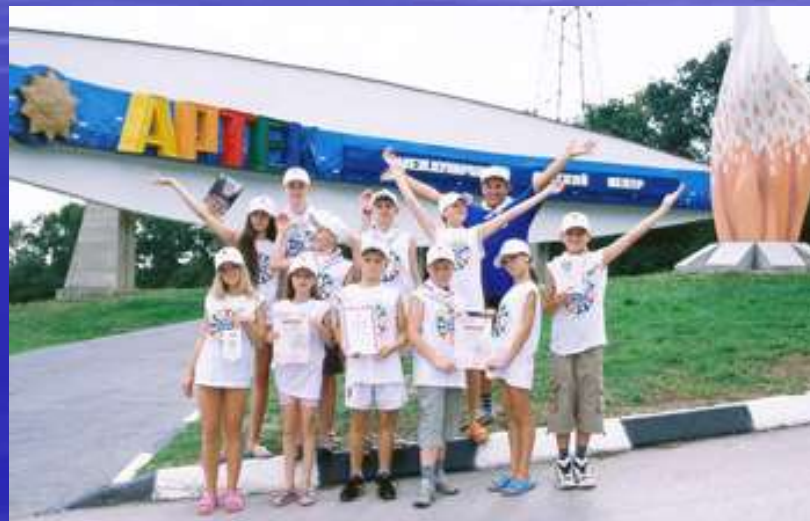
Международный детский центр «АРТЕК»

Ни одна фотосессия в Коктебеле не обойдет вниманием Волошинский профиль.