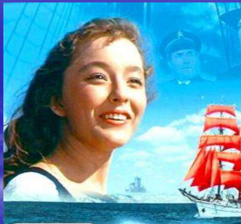
Фильм «Алые паруса» Режиссер А.Птушко