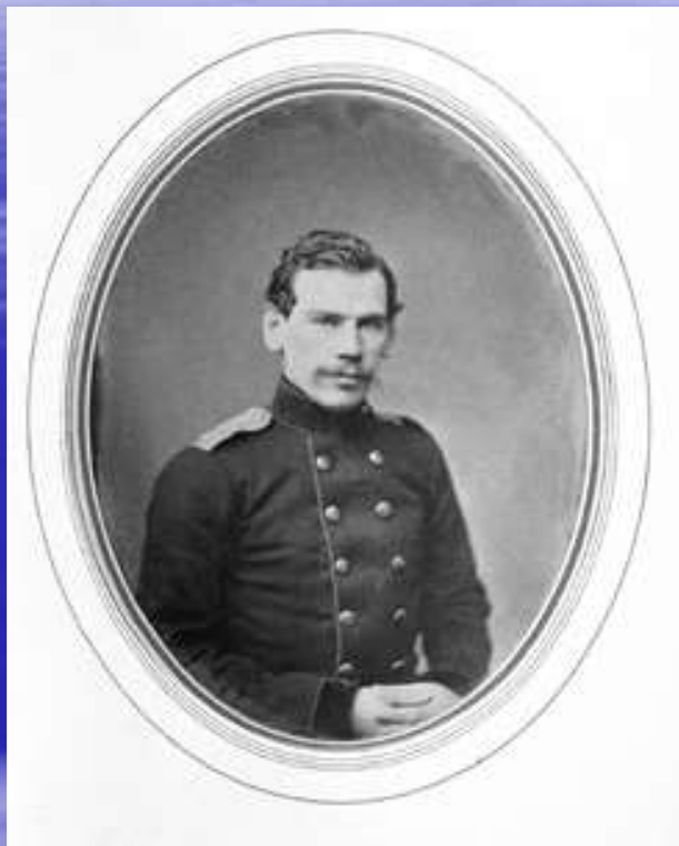
Л.Н.Толстой русский писатель