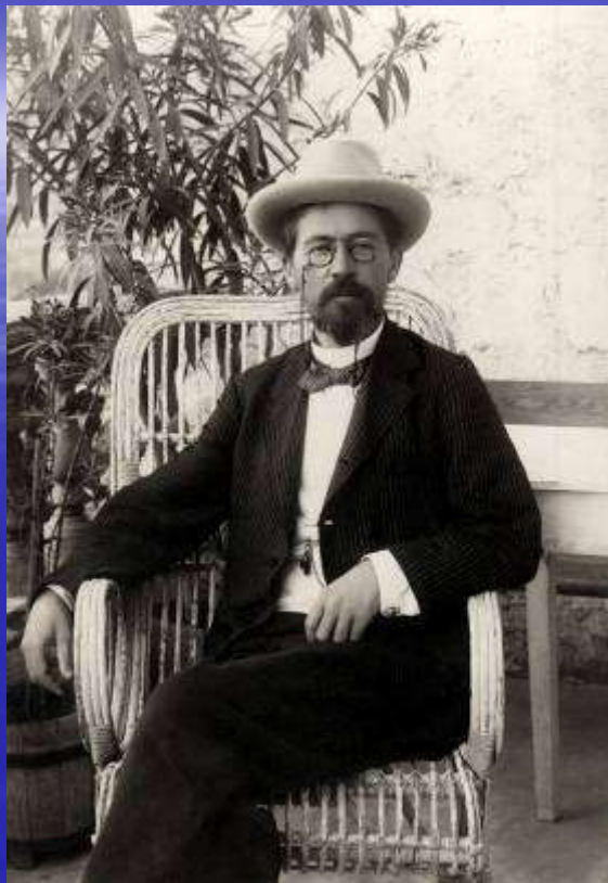
А.П.Чехов, русский писатель, драматург