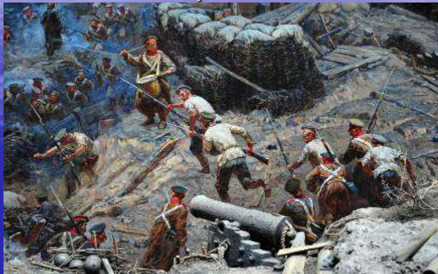
Крымская война. Оборона Севастополя

И с этого времени 250 лет мы жили вместе с Россией общей судьбой. Наша земля помнит великие и трагические события.