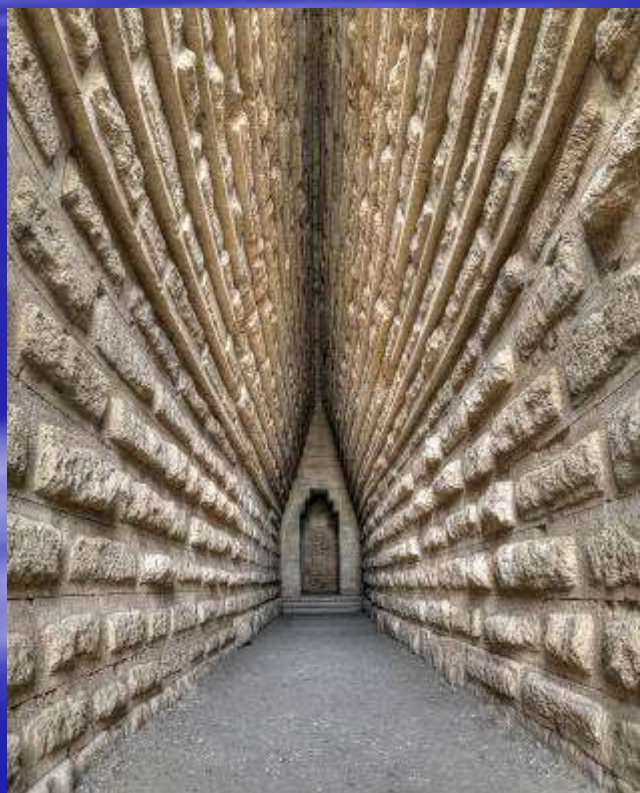
Царский курган – гробница Боспорского царя

На его благодатной земле издавна селились разные народы и образовывались разные государства. Крым в древности был частью Великого Боспорского царства, потом Византийской империи, потом нескольких кочевых империй, затем Крымского ханства, пока, наконец, не вошел в состав Российской империи.