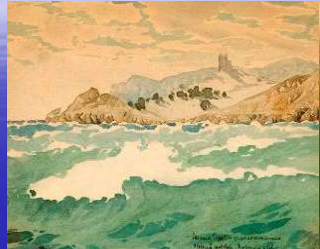
М.Волошин «Коктебель. Затока», 1928