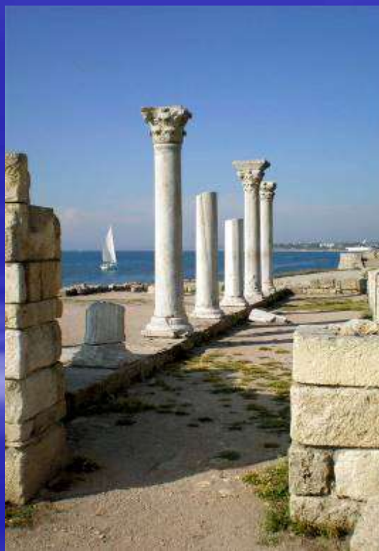
Развалины Херсонеса – древнегреческого города