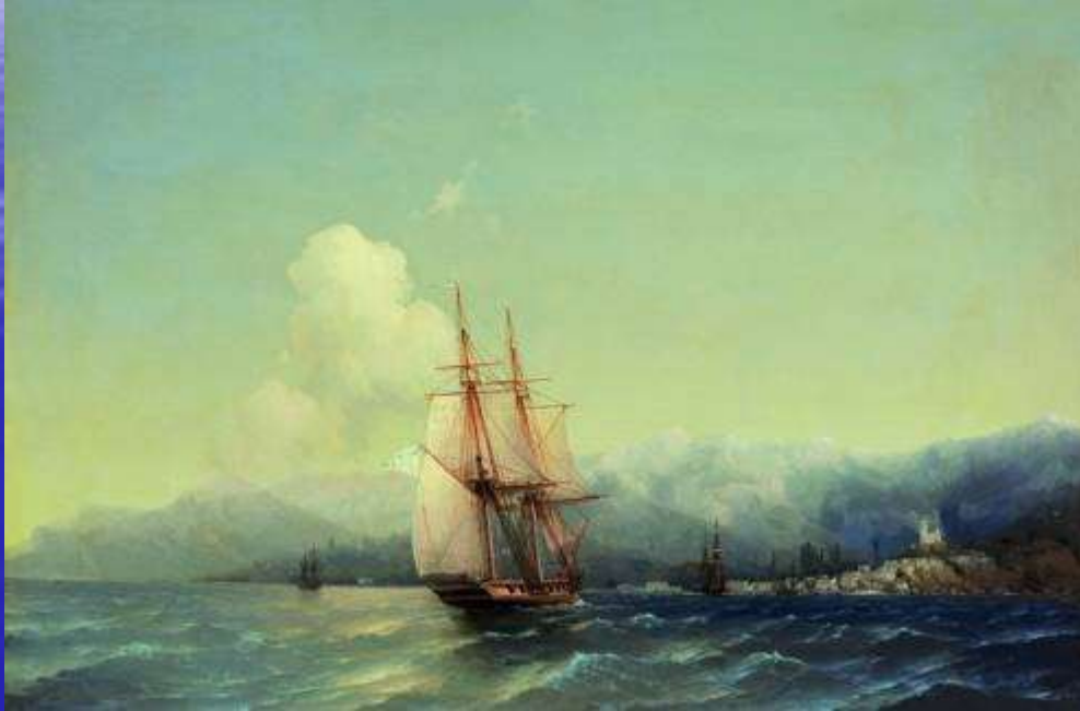
И.К.Айвазовский, «Крым», 1852 г.