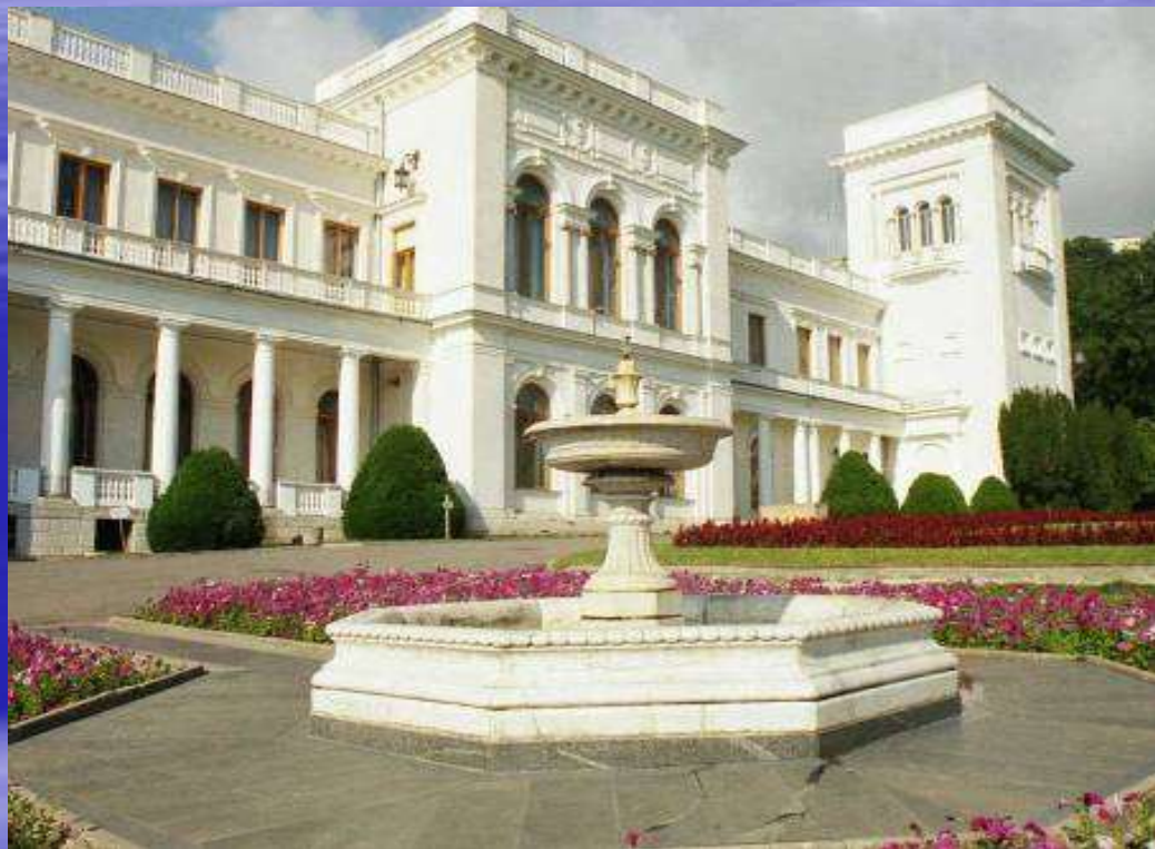
Ливадийский дворец архитектор Н.П.Краснов