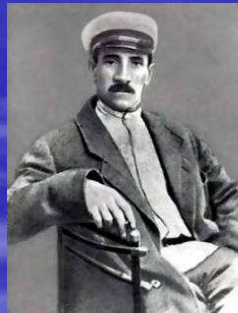
А.С.Грин, русский писатель- романтик