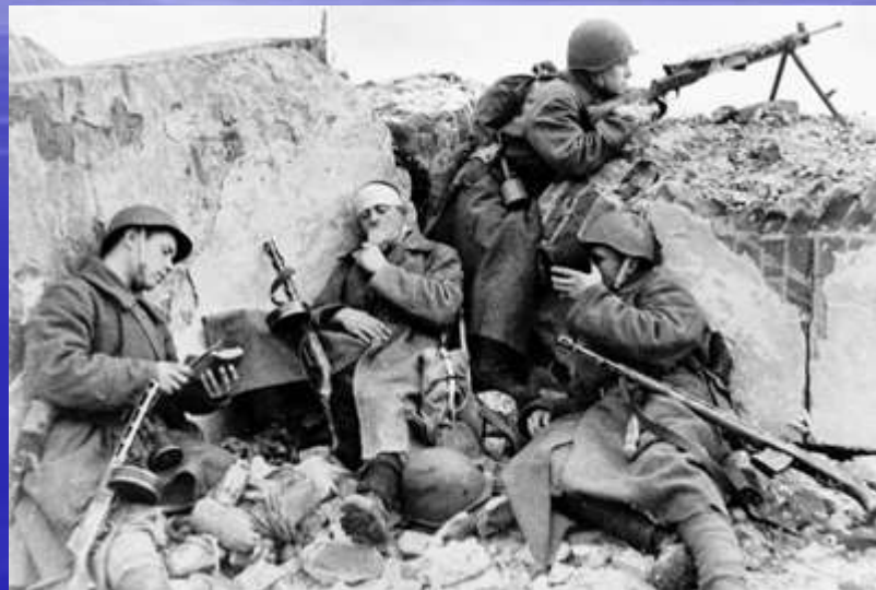
Отечественная война в Крыму