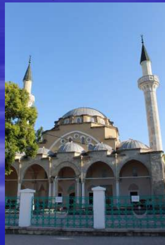
Мечеть Джума-Джами, Евпатория