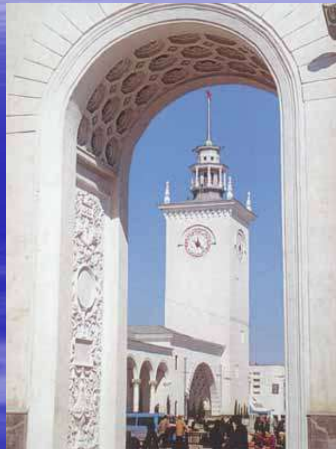
Симферопольский вокзал архитектор А.Н.Душкин