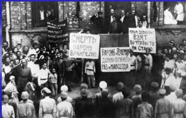
Гражданская война. Взятие Перекопа