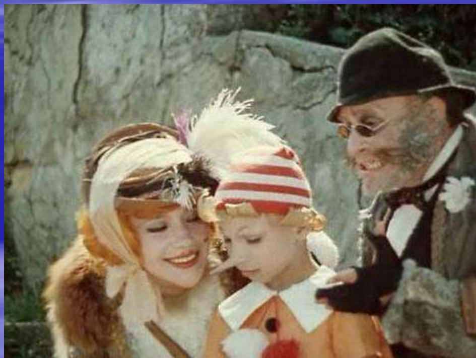
Фильм «Приключения Буратино» Режиссер Л.Нечаев

Снимали любимые фильмы «Приключения Буратино», «Алые паруса», «Остров сокровищ», «Приключения капитана Гранта», «Кавказская пленница», «Человек с бульвара Капуцинов» .